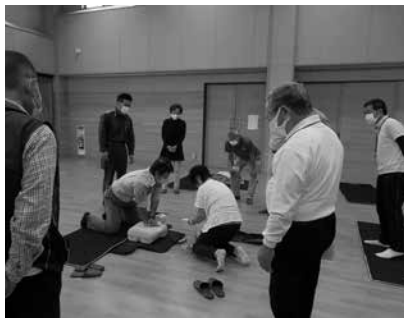
丁寧な楽しい講習でした。参加13名。