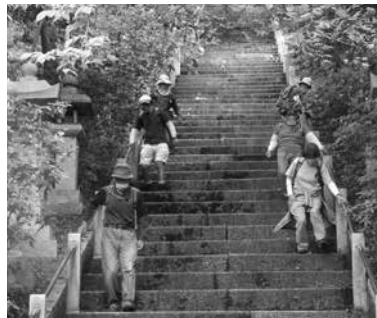
まだ馴染みの薄い七岡山巡り。参加7名。