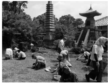
裏庭の清掃後、夏中法要の研修実施。参加17名。