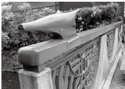
答えは次のページを参照